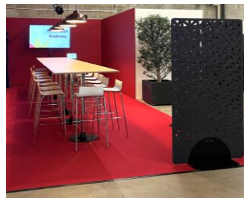
Darstellung eines Stammtisches